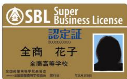
S B L 全種目取得